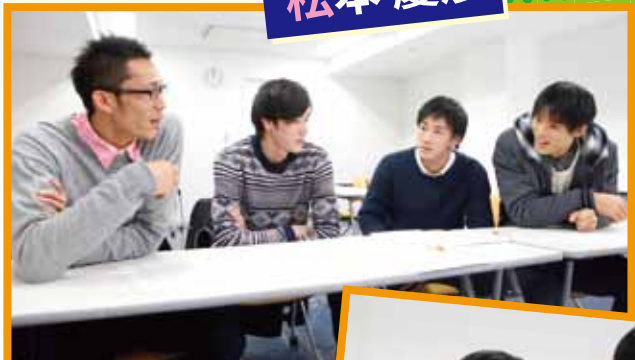
性格分析を終えた後の座談会。選手たちはそれぞれの性格を改めて知って理解を深めた!